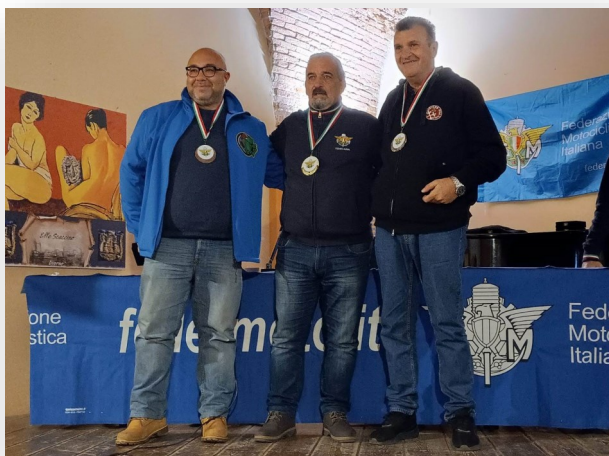
Sabato 25 Novembre Premiazioni a Livorno del Campionato Toscano Turismo e Motoraid